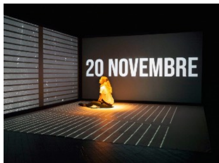
Mon Amour est mort étape de création - 2018