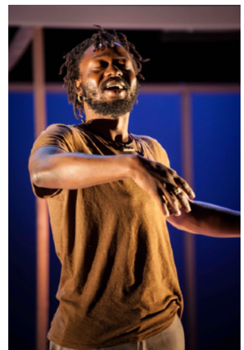
Ton beau Capitaine création 2018