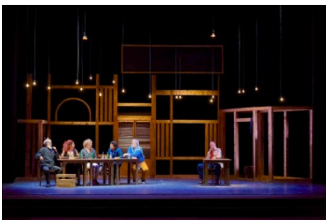
La Tablée - création 2020

La compagnie Les Heures Paniques est conventionnée avec la Ville de Metz depuis le 1er janvier 2016 et avec la Région Grand Est depuis le 1er janvier 2019.